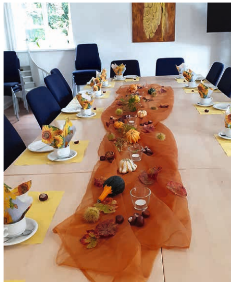
An unserem liebevoll gedeckten Tisch erfahren Sie bei Kaffee und Kuchen wert- volle Unterstützung und Gemeinschaft.

Besonders erfreulich ist, dass sich zunehmend auch Männer öffnen und den geschützten Rahmen des Cafés nutzen, um über ihre Gefühle und Gedanken zu sprechen. Es entsteht ein Hauch von Vertrauen, der sich manchmal zur Freundschaft entwickelt.